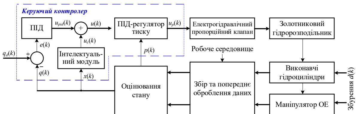
Рис. 3. Структура підсистеми реалізації керування маніпулятором ОЕ

У цій роботі пропонується структура підсистеми реалізації керування (рис. 3), оскільки вона є кінцевою ланкою ІКС, де інформаційні рішення верхніх рівнів перетворюються на фізичні впливи на гідропривід і ківш. Саме на цьому рівні проявляються невизначеності, що безпосередньо визначають якість здійснення робочого процесу ОЕ