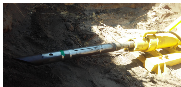
Рис. 2. Процес проколювання ґрунту експериментальною установкою з можливістю керування траєкторією руху головки в підземному просторі

Реалізація процесу проколювання ґрунту з керуванням руху головки з асиметричним наконечником зображено на рис. 2.