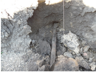
Рис. 3. Заміри відхилення руху головки з асиметричним наконечником на виході в приймальному котловані