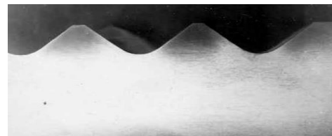
Рис. 3. Макроструктура валика после обработки по 3-му режиму

Обращает на себя внимание, что после обработки по режимам 2 и 3 упрочненный слой неравномерен, имеет размытые границы (рис. 3), что свидетельствует о значительном рассеянии электромагнитного поля.