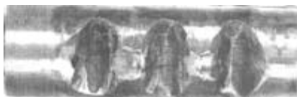
Рис. 2. Общий вид вышедшего из строя валика коробки передач

Выборка основной массы деталей производится по причине значительного износа и разрушения в местах контакта фиксатора и валика (боковые поверхности и края лунки) и смятия между лунками (рис. 2). Также наблюдается износ цилиндрической поверхности валика при передвижении его вдоль оси в корпусе коробки передач.