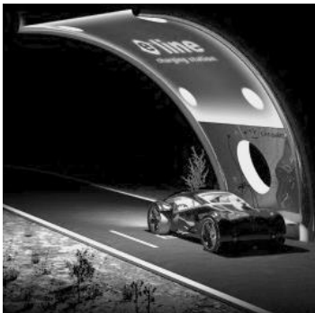
Рис. 9. Сонячна зарядна станція e-line

Зарядні станції для електромобілів S1.CH-150 української фірми E-line призначені для швидкісного режиму зарядки електротранс-порту (від 15 до 30 хв) за стандартами CHAdeMO і CCS. Конструкція станцій поєд-нує в собі високі функціональні вимоги (за-рядна станція, джерело електроенергії на со-нячних панелях і навес) [13] (рис. 9).