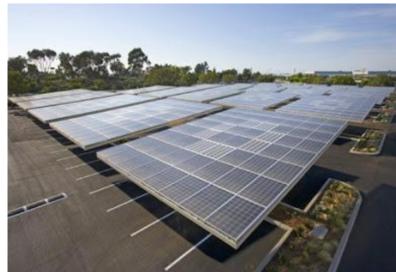
Рис. 6. Сонячна зарядна станція-стоянка Envision Solars Solar Groves

Solar Grove перекладається з англійської як «Сонячний гай». Solar Grove – це автостоянка й електрозаправка одночасно. За словами виробників, енергії, що виробляється фотоелементами, вистачить на нічне освітлення і зарядку цілого парку електромобілів (рис. 6) [5, 9].