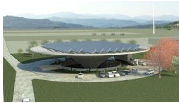
Рис. 5. Сонячна зарядна станція Geotecturas Green Gasoline Station

Станція має також зону обслуговування та кафе, які розміщені під землею. Сонячна енергія та енергія вітру перетворюються в електричну і використовуються для живлення самої станції та електромобілів.