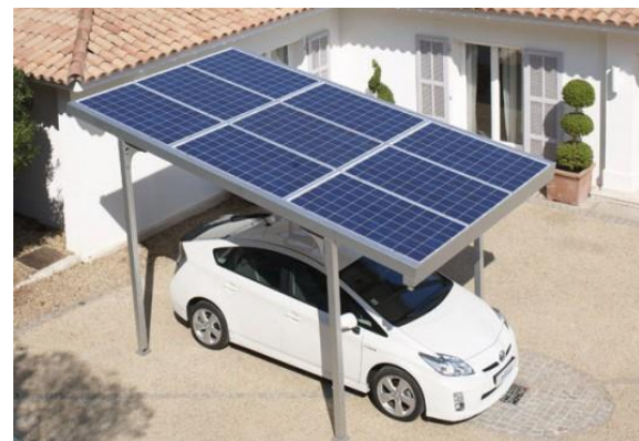
Рис. 8. Сонячна зарядна станція Rentechno Поки такі станції виготовляють за індиві-

Домашня версія сонячної станції для електромобілів виконана у формі «даху». Вдень така станція накопичує енергію, а вночі від неї можна зарядити один або кілька електромобілів (рис. 8).