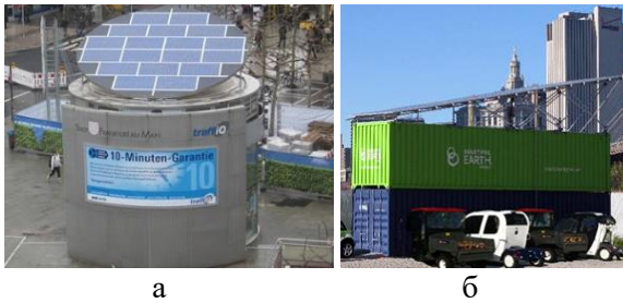
Рис. 1. Сонячні зарядні станції: а – Evergreen Solar Fuel Station; б – Beautiful Earth Group solar EV Charger

ликих електричних автотранспортних засобів, включаючи велотаксі, сігвеї, електричні велосипеди і скутери.