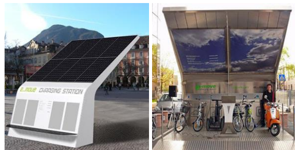
Рис. 3. Сонячна зарядна станція E-Move Charging Station

E-Move Charging Station – один з різновидів компактних стоянок-зарядок для електричних скутерів і електромобілів (рис. 3) [5, 8].