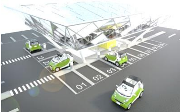
Рис. 4. Сонячна зарядна станція EVOasis Solar Charging Station

Компанія EVOasis за основу сонячних електростанцій вирішила взяти занедбані бензоколонки Лондона (рис. 4).